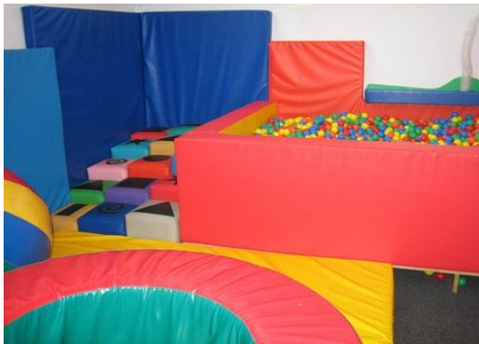
“soft play room”

In het gesprek met de adjunct directeur, een voorstander van inclusief onderwijs, werd duidelijk dat de leerlingen op de school geen van allen voldoende begeleid zou kunnen worden op een reguliere, inclusieve, school. De behoeften van de leerlingen zijn dermate specifiek dat begeleiding op een speciale school noodzakelijk is. De leerlingen hebben voorzieningen nodig die hen op een reguliere school niet geboden kunnen worden. Van de voorzieningen wordt ook gebruik gemaakt door leerlingen van de andere scholen uit de wijk Newham. Op die wijze vindt een ontmoeting plaats tussen de verschillende groepen leerlingen.